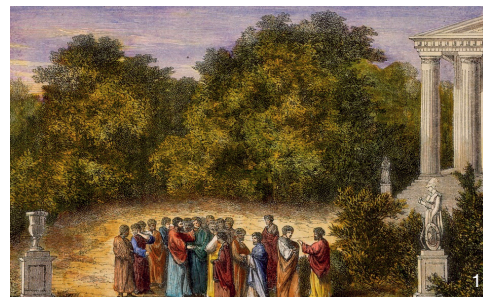
1 古希腊文人园 [6] Literati gardens of ancient Greece [6]

自己的庄园、园林等向公众开放，并逐步形成了一种私家园林在特定时间面向公众开放的风气。